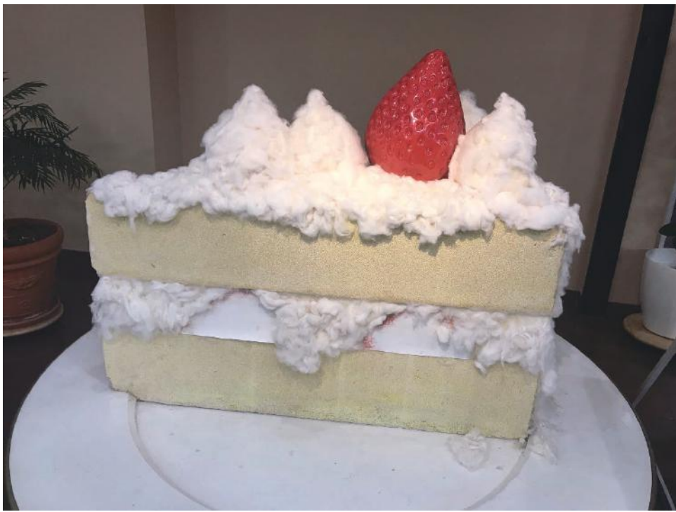
突然巨大な食べ物が登場(原料:今治タオル) お気に入りの一枚を撮ってみては？