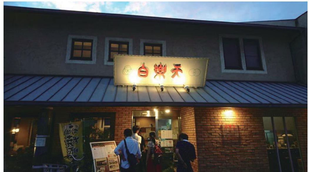
日も暮れてきたので晩ご飯 今治駅から徒歩で白楽天へ。絶品B級グルメ、今治焼豚玉子飯に舌鼓