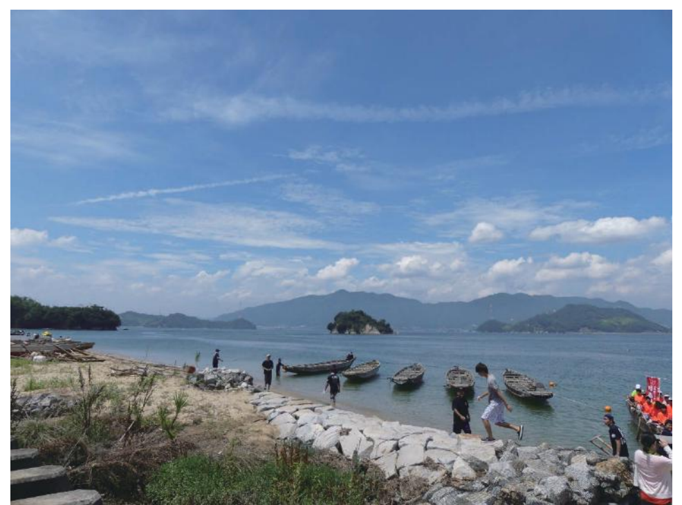
因島で小舟体験「ヨーシ」「ソーレ！」の掛け声が響く 一艘500万円するとか。