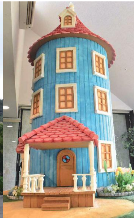
今治タオル美術館