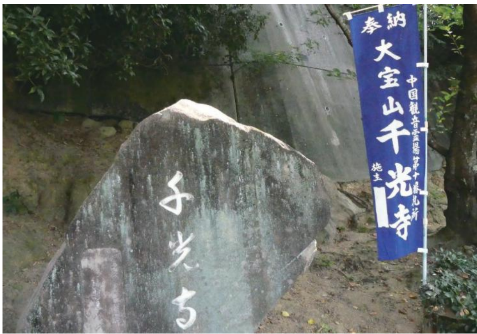
806年創建 港町として栄えた尾道の町並みを見渡せる 「この岩の上に宝珠あり。夜毎、遙か海上を照らす。」という伝説も。